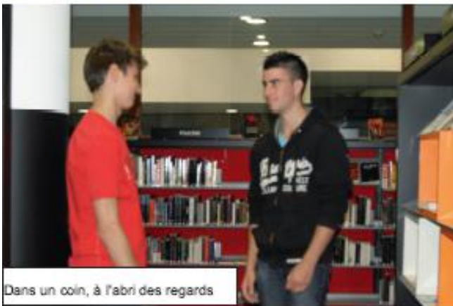
Dans un coin, à l'abri des regards