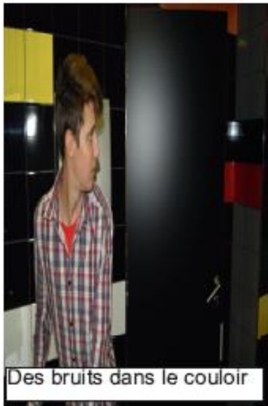
Des bruits dans le couloir

Quelle vie de merde ! Je ne suis pas si différent des autres !