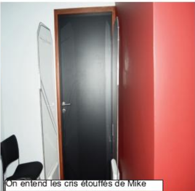
On entend les cns étouffés de Mike